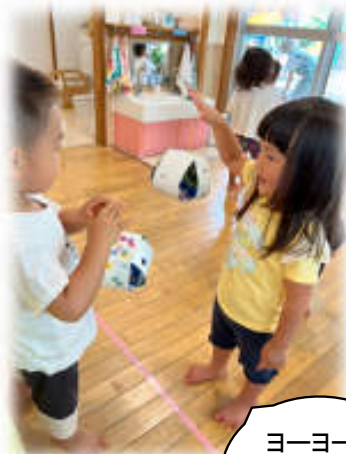
ヨーヨーを作ったよ!

・室内遊び(保育者が子どもたちの興味や発達に合わせて手作り玩具、知育玩具などを用意しています。小麦粉粘土やゼリー遊びなど、安全な素材にこだわり、手指を使うことで五感の発達を促します。)