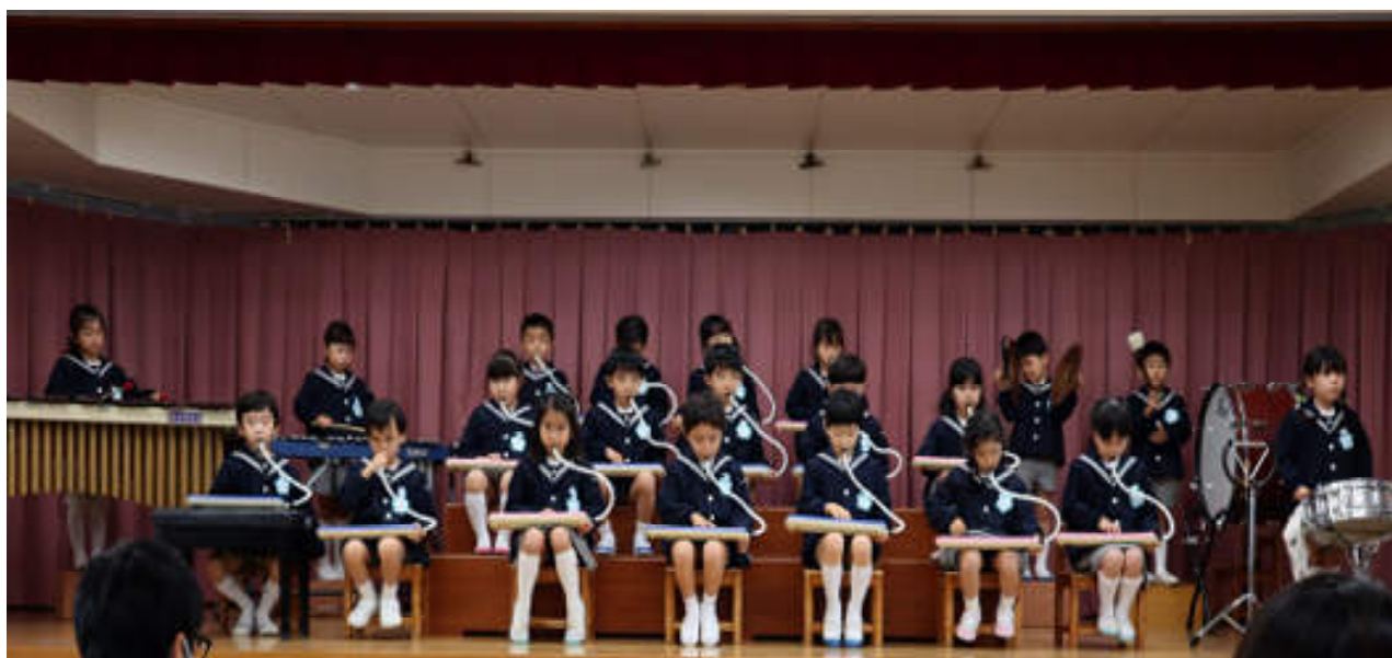
生活発表会 年長児合奏

歌ったり、リズム表現をしたり楽器を奏でることは音楽を楽しむ心を育て、創造性、感受性を豊かに広げていきます。