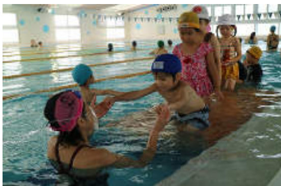
グランツスイミング 水慣れから泳法まで丁寧に指導 します。貸切送迎バスで通います。