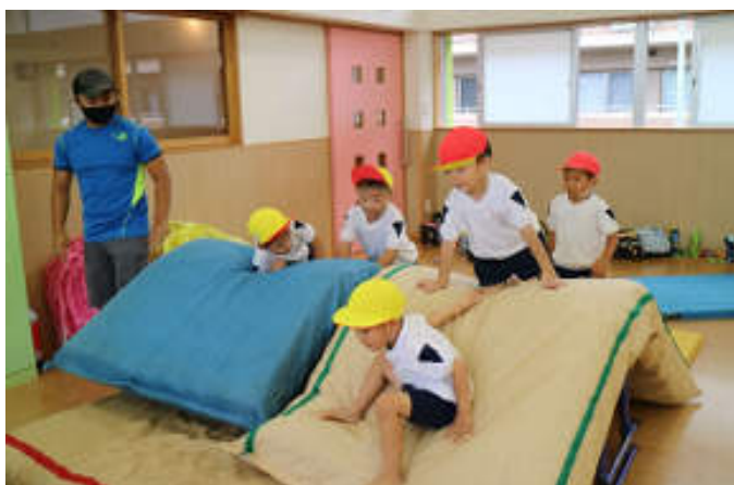
気のいい羊たち チャレンジキッズ

保育終了後、希望により、課外活動の受講ができます。預かり保育中でもご連絡いただければお子さんを誘導します。