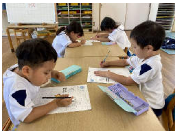
学研プレイルーム